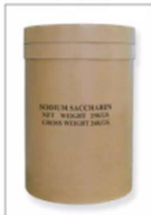
Export 50kg/Cardboard Drum