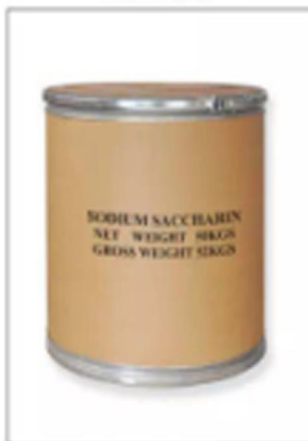
Export 50kg/Fiber Drum