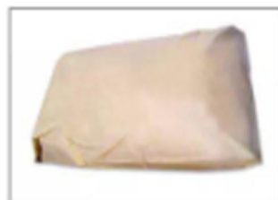
Export 25kg/Kraft Bag